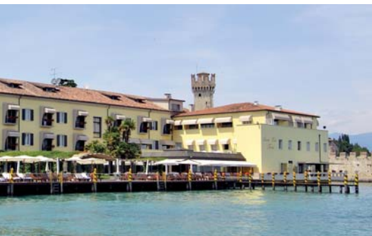
Grand Hotel Terme ★★★★★

Grand Hotel Terme è situato sulle sponde del lago, all'entrata del centro storico e gode di una vista incantevole e suggestiva.