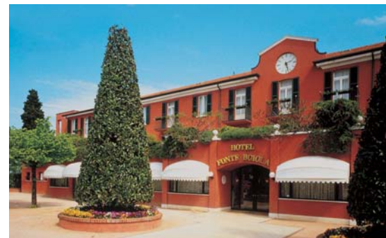
Hotel Fonte Boiola ★★★

Hotel Fonte Boiola, anch'esso situato in riva al lago accanto al Grand Hotel Terme gode di una tranquillità e un panorama eccezionali.