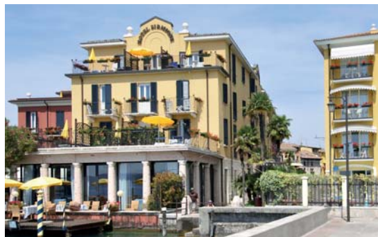
Hotel Sirmione ★★★★★

Hotel Sirmione è nella famosa piazzetta centrale della cittadina, a pochi passi dal Grand Hotel Terme, accanto al magico Castello Scaligero.